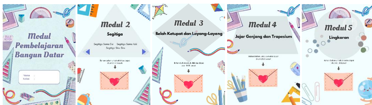
Gambar 1. Contoh-contoh halaman judul modul

Gambar 1 hingga 3 menunjukkan tampilan fisik dari modul pembelajaran interaktif matematika yang dibuat. Modul ini dirancang untuk memberikan pengalaman belajar konkret melalui aktivitas manipulatif menggunakan media seperti kawat, benang, magnet, kartu bangun datar, dan kertas foam. Setiap aktivitas dalam modul disusun agar murid dapat mengeksplorasi konsep bangun datar secara visual dan kinestetik, seperti menempelkan bentuk, menyusun gambar, serta menghitung luas dan keliling dari hasil karya mereka. Desain modul mempertimbangkan keterlibatan multisensoris, estetika visual, serta kesesuaian dengan tahap perkembangan kognitif murid sekolah dasar.