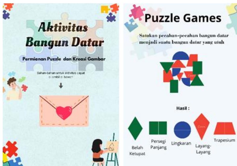
Gambar 2. Contoh aktivitas permainan puzzle